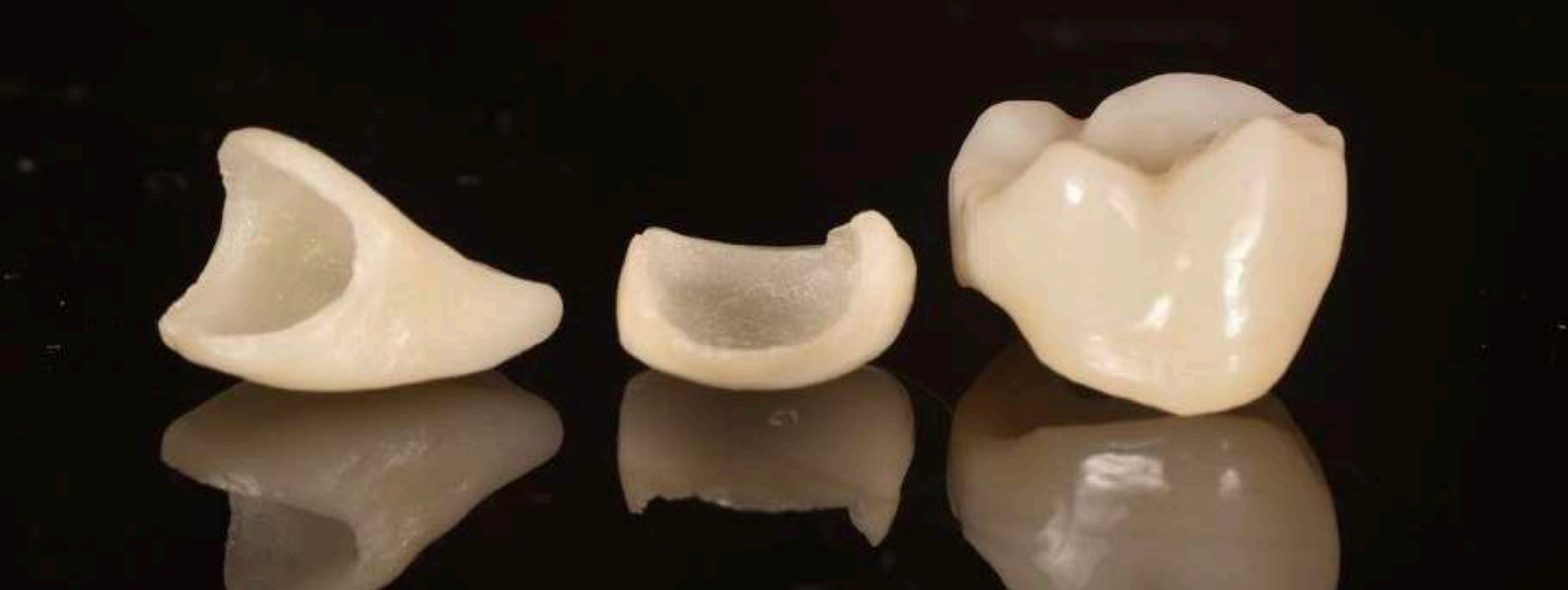
FOTOGRAFÍAS tomadas por nuestros PARTICIPANTES